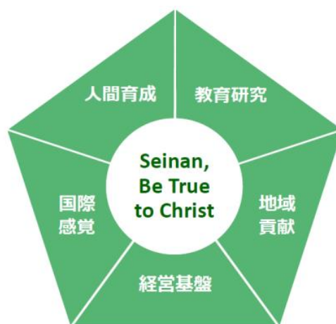
図1 「西南学院ビジョン 2016-2025」