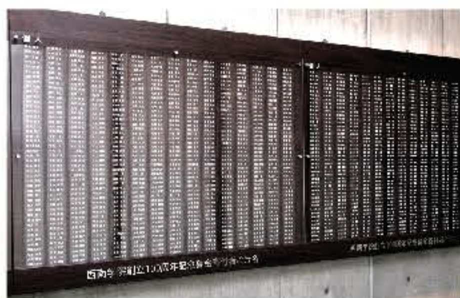
寄付者銘板(1階ホワイエ)

同窓生や、地域の皆さま、在校生、教職員など、さまざまな方が集い、交流できる拠点として、ぜひご活用ください。