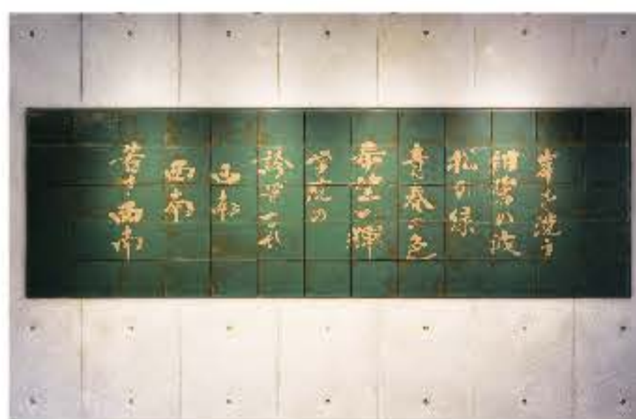
高取鏡による校歌(1階エントランスホール)