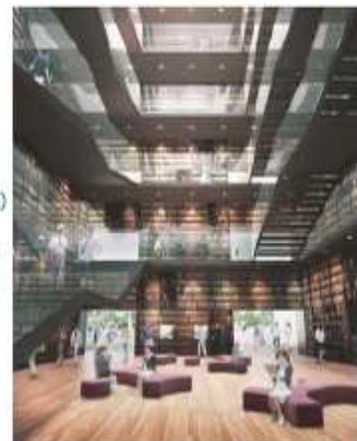
図02 西南の知(神学書、河書、歴史展示を配架)自律性を触発するブックツリーのイメージ

名称：リフレッシュ 高層塔西側に設置。クスノキの緑の風景が新たな創造・思考の拠となる 4~6F: スーパーサイレント キーボードの音も許容しない集中した知識理解の場 4~6F: 閲覧スペース 席間に設置し、個人の領域を尊重した読書学習する姿が街やキャンパスから見える