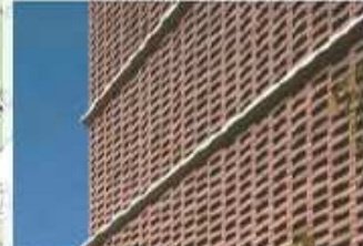
図03 「積層した知識」を表現するレンガトレスリヤー外観イメージ

4.西南の伝統と知識を 都市に伝える赤レンガ外壁 キャンパスの統一感と知識を積む意味をレンガを積む=積層した知識として表現したレンガトレスリヤーによる図書館外観