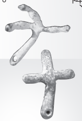
十字架【原城跡出土遺物】 (南島原市蔵)