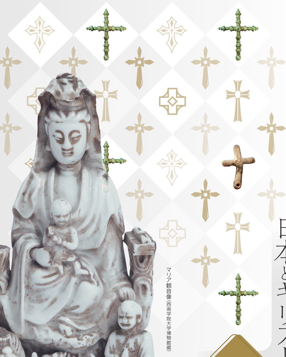
マリア観音像 西南学院大学博物館蔵