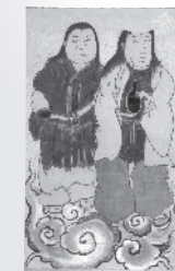
お掛絵 (西南学院大学博物館蔵)