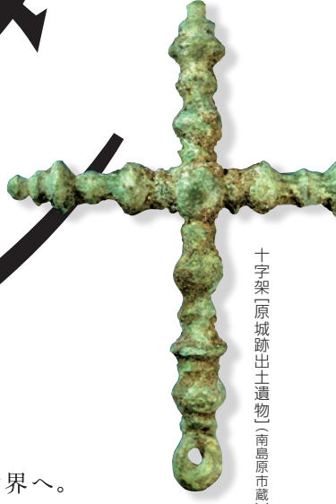
十字架「原城跡出土遺物」(南島原市蔵)

西南学院大学博物館 [開館時間] 午前10:00~午後6:00 *入館は閉館の30分前まで [休館日] 毎週日曜日 Nov.2 Fri - Dec.13 Thu, 2018 Seinan Gakuin University Museum Special Exhibition Hours: 10:00-18:00 [Last Admission 17:30]