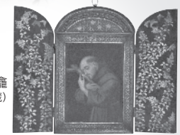
枝垂れ桜蒔絵螺鈿聖龕 (大村市立史料館蔵)