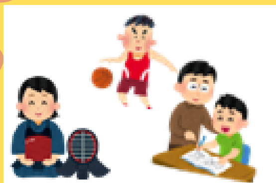
授業やクラブ活動の支援など