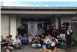
@初代うきはベースでの集合写真

2017年7月に発生した九州北部豪雨により甚大な被害が発生した朝倉市や東峰村において、被災地で求められるニーズと「うきはベース」を利用する学生とをマッチングして被災地支援を促進させるための宿泊・情報共有・情報発信のための拠点です。2017年7月22日に開設以来、3月末までの間に全国から1546名もの学生達が寝食を共にしながら、日中は現地での支援活動、夜はベースで情報共有ミーティングを行ってきました。今期からは第1週・第3週の土日を中心に開設します。また、現在は初代うきはベース(うきは市ムラおこしセンター)から場所を移して、二代目うきはベース(旧JAにじ山春支店)にて活動を行っています。皆さんの参加をお待ちしております。