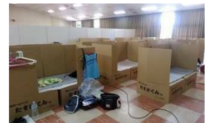
@うきはベースで利用する段ボールベット

うきはベースはNPO法人ANGELWINGS・西南学院大学・北九州市立大学の3者が連携して運営する宿泊・情報共有・情報発信のための拠点です。