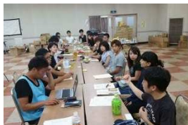
@ミーティングの様子